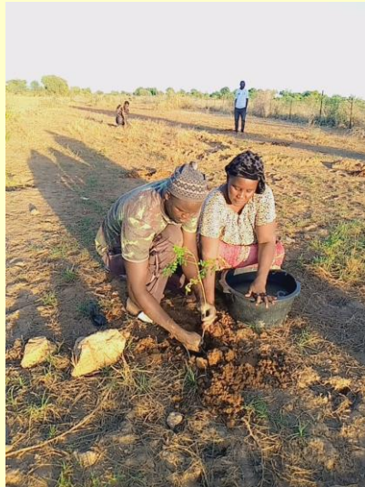
Plantation en cours de moringa

Cette deuxième action est estimée à 60 200 €. Nous venons d'apprendre que les principaux financements sollicités pour cette action sont accordés ( 51 000 €)