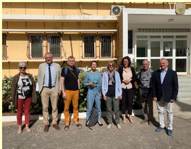
Réception à l'Ambassade de France avec nos amis du Réseau PDLCI

Comme à chaque voyage nous sommes accueillis avec beaucoup de chaleur humaine (et climatique) et nous revenons avec un cartable rempli de demandes d'aides.