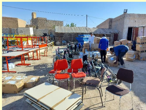
Réception du matériel dans la ville de Arafat ( banlieue de Nouakchott)

« La mairie d'Arafat a l'honneur, en son nom propre et au nom de ses habitants, d'adresser ses vifs remerciements et sa profonde gratitude à votre association pour le généreux soutien que vous accordez à la commune et qui s'inscrit dans le cadre de la coopération entre les deux institutions, espérant que ce partenariat soit le prélude d'une coopération durable ».